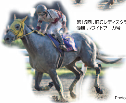
第15回 JBCレディスクラシック(Jpn1) 優勝 ホワイトフーガ号