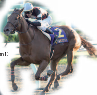
第15回 JBCスプリント(Jpn1) 優勝 コーリンベリ号