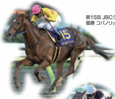
第15回 JBCクラシック(Jpn1) 優勝 コパノリッキー号