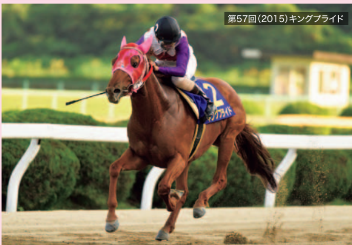
第57回(2015)キングブライド

圧倒的な逃げ切りで3連勝中のキングブライドが単勝1.6倍の断然人気で、同じく3連勝中でレースを迎えたマイネルジャストが2番人気。しかし実戦では持ち時計に勝るキングブライドが先手を取り、中団から差を詰めにかかったマイネルジャストに影を踏ませぬスピードを見せ、5馬身差をつけて快勝した。そして2着と3着の間についた差は2.2秒。まさに人気2頭の一騎打ちとなったダービーだった。